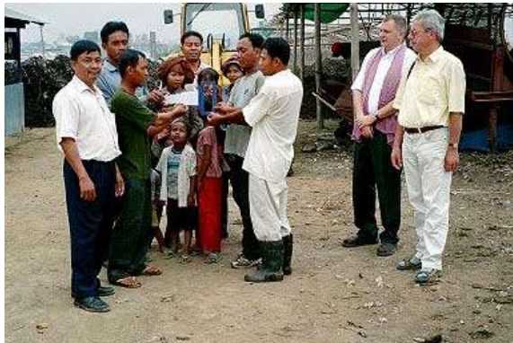
Übergabe der Pilotkompostierungsanlage an unsere Partnerorganisation COMPED