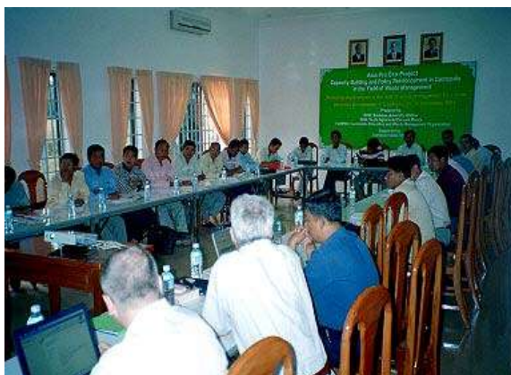
Schulung in Kambodscha