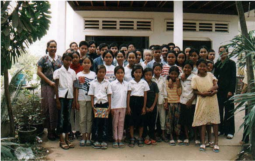
Patenkinder der TKG